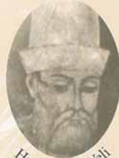
Hacı Bektaş Veli